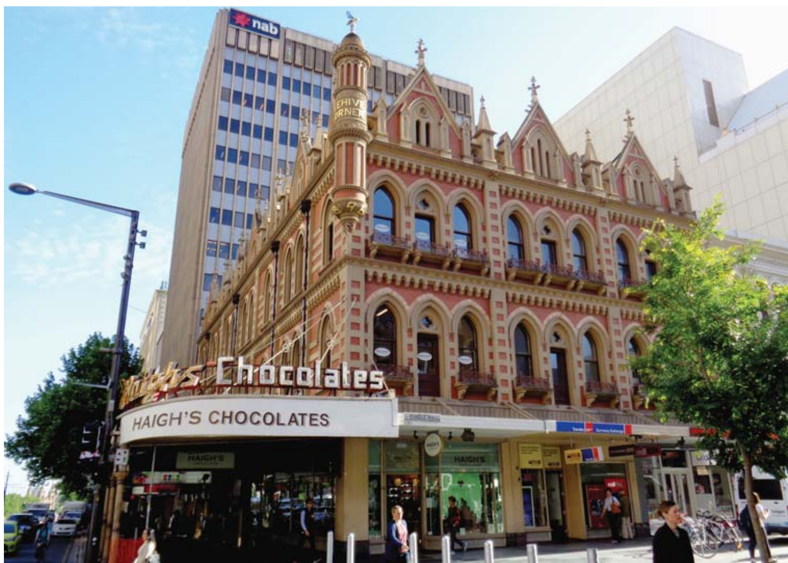
Urbanisme. Un savant métissage d'architecture victorienne et contemporaine.