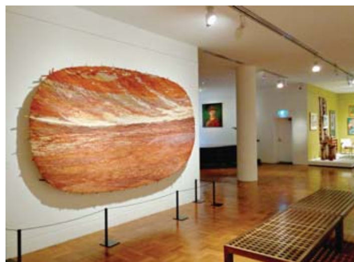
Culture. La section aborigène aux Musée des Beaux-Arts.

Ceux qui entendent explorer la voisine île Kangourou ou les grands espaces de l'arrière-pays (outback) ne regretteront pas de les avoir ajoutés à leur itinéraire, histoire de profiter des environnements sauvages entourant l'agglomération. C'est là qu'ils retrouveront au plus près les sentiments d'exaltation – d'angoisse et d'isolement aussi – vécus par les premiers colons débarqués aux antipodes. Ils en ramèneront assez d'images de koalas, wallabies et clichés de western pour nourrir leurs rêves, une fois rentrés au pays.