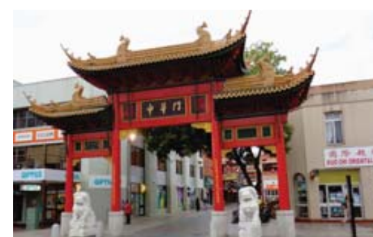
Communautés. Adélaïde a aussi son Chinatown.

Les autorités d'Adélaïde annoncent des chantiers d'embellissement. «Vous verrez bien: difficile de vous y perdre. C'est comme à New York ou à La Chaux-de-Fonds», avait dit le responsable de l'agence de voyages. De fait, si le centre de la ville fondée en 1836 par le Hollandais Peter Nuyts répond au même quadrillage, ici s'arrête la comparaison avec Manhattan ou notre cité horlogère. De la première, Adélaïde ne connaît ni les gratte-ciel ni l'effervescence; de la seconde, elle se distingue par son harmonieux métissage architectural entre réminiscences victorienne et modernité.