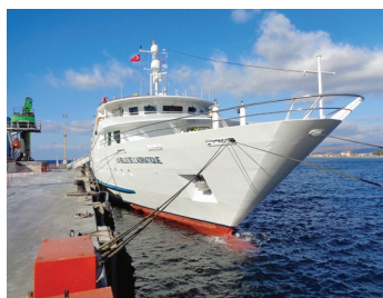
ESCALE Les dimensions du bateau facilite son accès aux petits ports.

Pour la première fois cette année, CroisiEurope navigue dans le détroit du Bosphore entre Europe et Asie mineure. Sous le label de CroisiMer, La Belle de L'Adriatique (198 passagers, 99 cabines) emmène ses passagers – d'un samedi à l'autre – du Pirée à Istanbul (ou l'inverse). Les di-