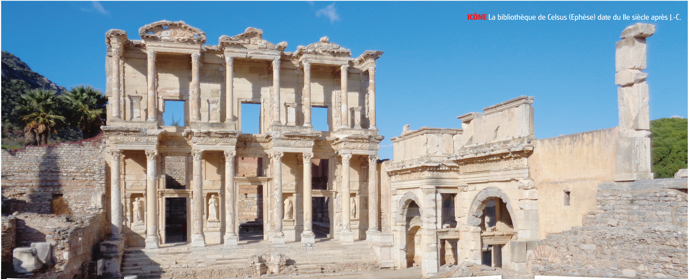
ICÔNE La bibliothèque de Celsus (Ephèse) date du IIe siècle après J.-C.