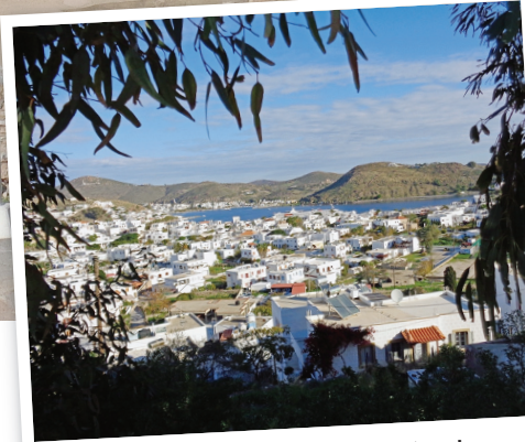
PATMOS C'est sur cette île que l'apôtre Jean rédigea son Apocalypse.