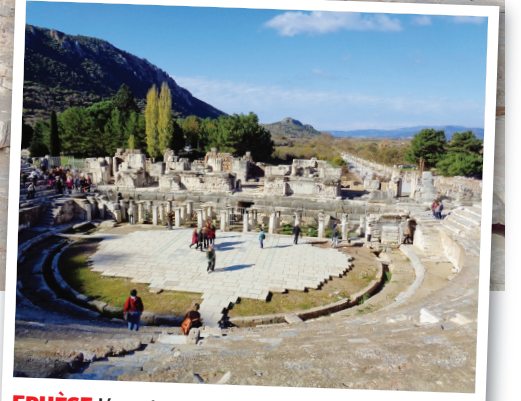
EPHÈSE L'un des joyaux des sites archéologiques turcs.