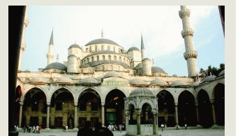
ISTANBUL L'ancienne Constantinople symbolise le lien entre Europe et Asie.