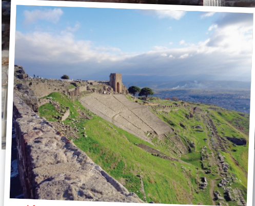
THÉÂTRE Des gradins vertigineux pour 30 000 spectateurs, à Pergame.