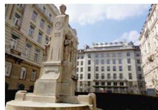
Architecture. La Caisse d'Épargne, emblématique d'Otto Wagner.

C'est surtout dans ses portraits de femmes que Klimt porte la peinture Art Nouveau à son apogée. Sa toile la plus célèbre – «le Baiser» – est exposée au Belvédère supérieur (lequel possède, avec 24 créations majeures, la plus vaste collection au monde de cet artiste hors normes). On retrouve aussi sa pièce maîtresse – hélas défigurée – sur les t-shirts, mugs, cendriers et parapluies des marchands de souvenirs. Mieux vaut en rire. Avec Schiele, on ne rigole pas. Chez lui, l'image du corps – souvent le sien – évolue vers une vision extatique, voire démoniaque. Heureusement, ses paysages naturels et urbains, chefs-d'œuvre de l'expressionnisme, font office de garde-fou pour éviter que le visiteur du Musée Leopold n'adhère trop intimement aux tourments de l'artiste mort à 28 ans. Un petit creux? Une escale gourmande au Naschmarkt a de quoi satisfaire toutes les envies, entre terroir et exotisme. Cet appétissant marché expose aussi, à sa façon, l'étonnante diversité du pot-pourri viennois.