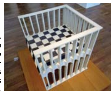
Design. Les formes du modernisme à l'honneur dans les musées viennois.