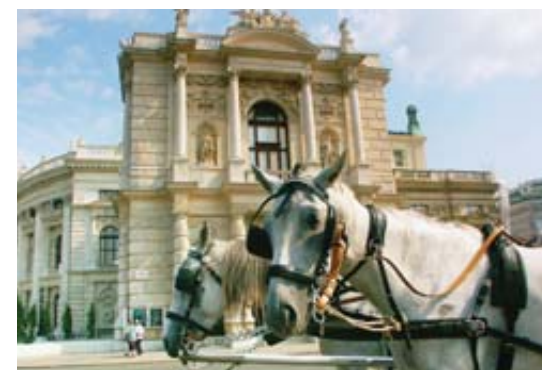
Théâtre. Inauguré en 1888, le Burgtheater a précédé le modernisme.