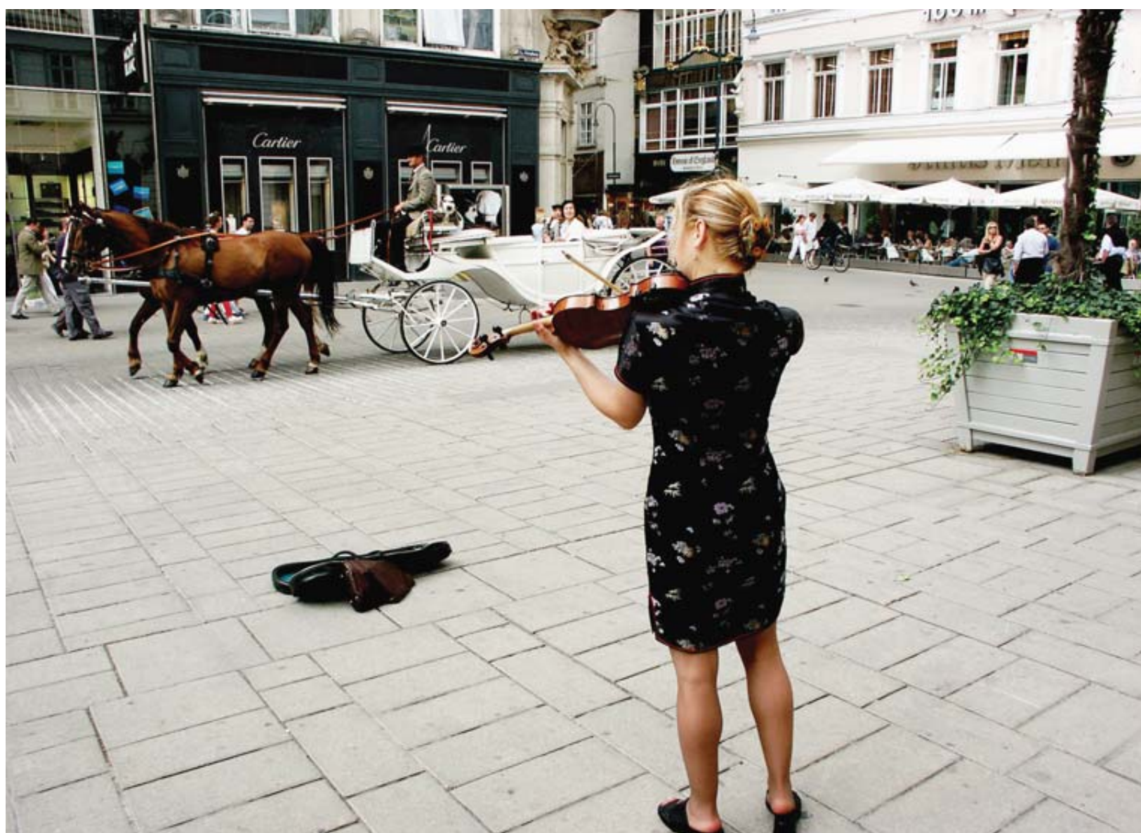
Ambiance. Vienne offre un saisissant contraste entre héritage et modernité.

TEXTE BERNARD PICHON