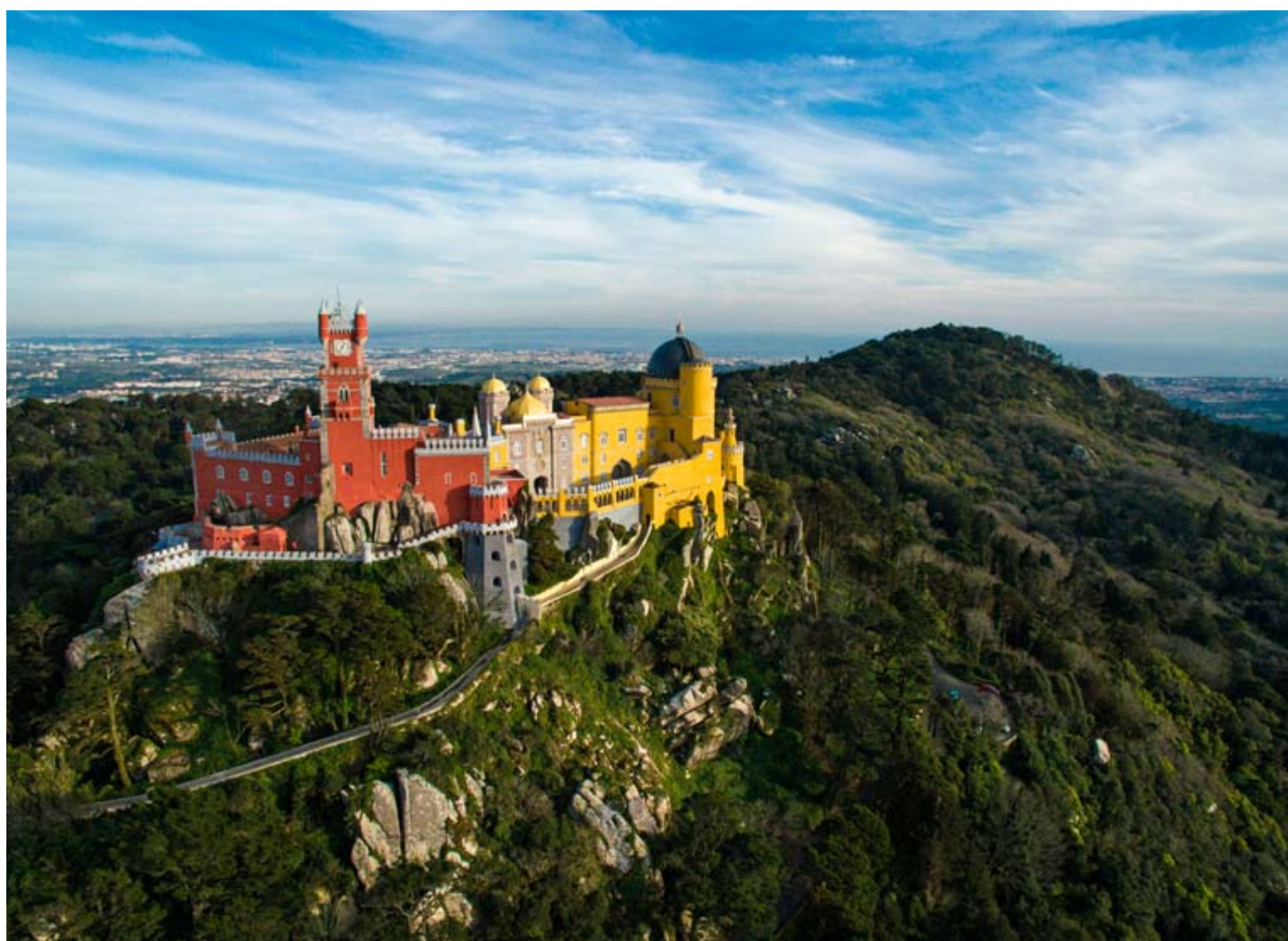
Extravagance. Le palais de Pena est situé au cœur d'un parc de 200 hectares.

TEXTE BERNARD PICHON