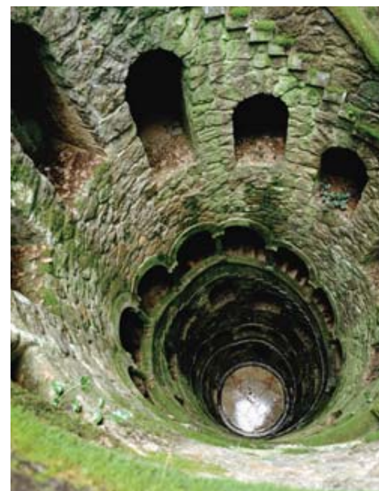
Vertige. Le Puits initiatique du palais de la Regaleira.

«Et maintenant, pénétrons au cœur du mystère!», lance le guide de la Quinta da Regaleira en tendant à chaque visiteur une torche électrique. Tout ce qu'on distingue, c'est un amas de rochers émergeant d'une végétation luxuriante. Mais voici qu'une imposante porte de pierre tourne sur elle-même, mue par un mécanisme caché. Elle dévoile soudain un puits monumental, sorte de tour inversée, vissée dans les profondeurs du jardin.