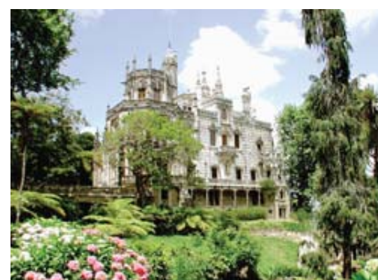
Magique. La Quinta da Regaleira émerge d'une végétation exubérante.