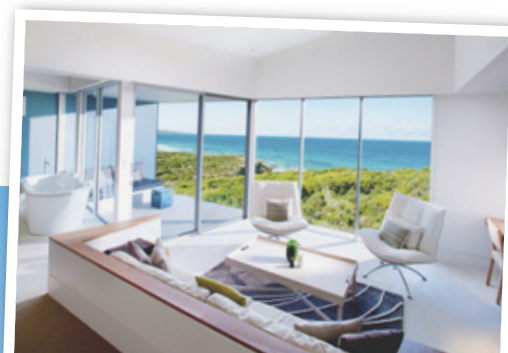
LUXE Le Southern Ocean Lodge est un must de l'hôtellerie australienne.