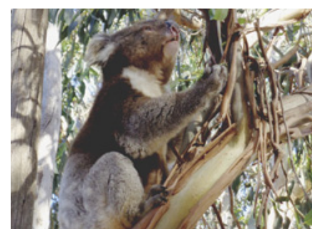
MASCOTTE L'île doit beaucoup de sa popularité à la présence des koalas.

L'observation du koala révèle la légitimité de son surnom: «paresseux d'Australie». Comme le mammifère arboricole d'Amérique tropicale figé sur sa branche, il semble totalement épargné par le stress, passant le plus clair de son temps à sommeiller, confortablement assis entre les fourches végétales. La fourrure de koala, particulièrement épaisse à la partie postérieure, constitue un doux matelas. Ce pelage en fait aussi la vedette des magasins de peluches. Pourtant c'est un bon grimpeur, aux mains, pieds et griffes bien adaptés à l'agrippement aux troncs et au maintien de l'équilibre. Habile à saisir les rameaux d'eucalypt-