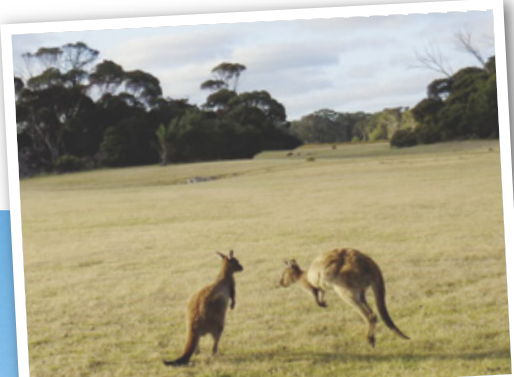
KANGOUROU Vu le faible trafic routier, cet animal est moins exposé sur l'île.