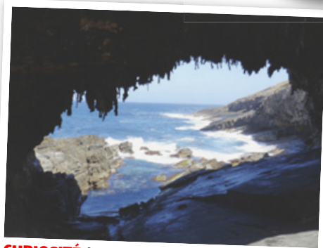
CURIOSITÉ Admirals Arch se donne des allures de caverne à pirates.