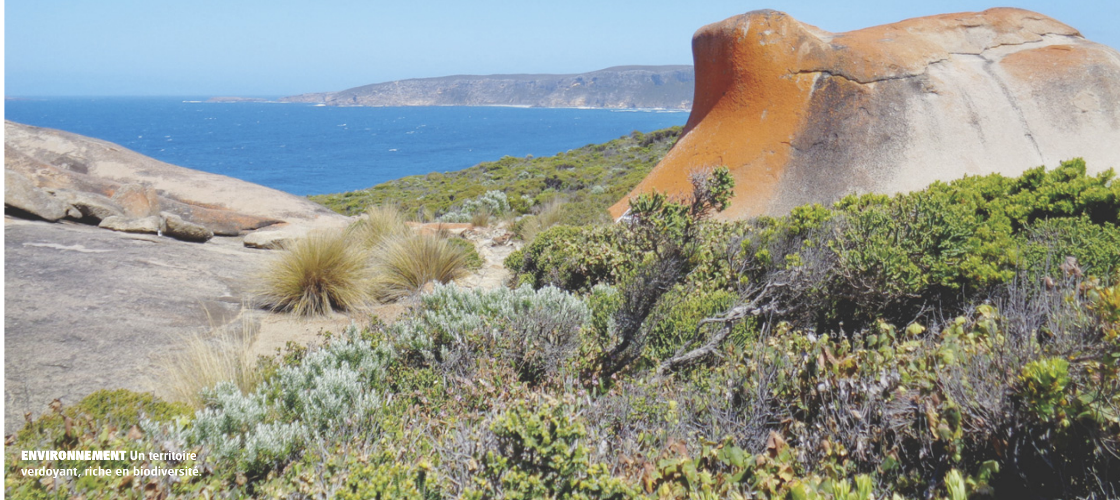
ENVIRONNEMENT Un territoire verdoyant, riche en biodiversité.

AUSTRALIE A quelques brasses d'Adélaïde, un éden sauvegardé témoigne des origines de la planète. On le visite pour sa biodiversité.