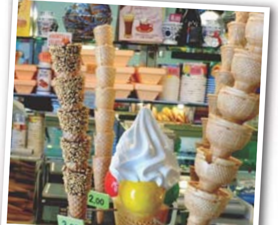
GELATI Le sorbet menthe-citron est un incontournable local.

ITALIE La Toscane n'est pas que Florence et Sienne.