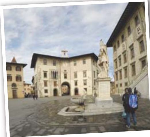
ARCHITECTURE La piazza dei Cavalieri et sa tour de l'horloge.