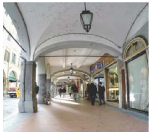
GALERIES Les amateurs de shopping se retrouvent sur le Borgo Stretto.