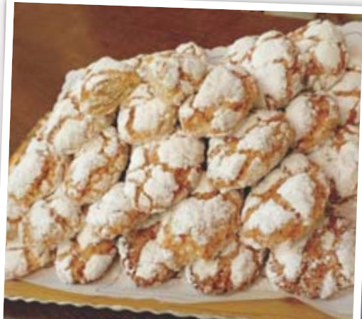
FRIANDISES Biscuits traditionnels de Toscane.