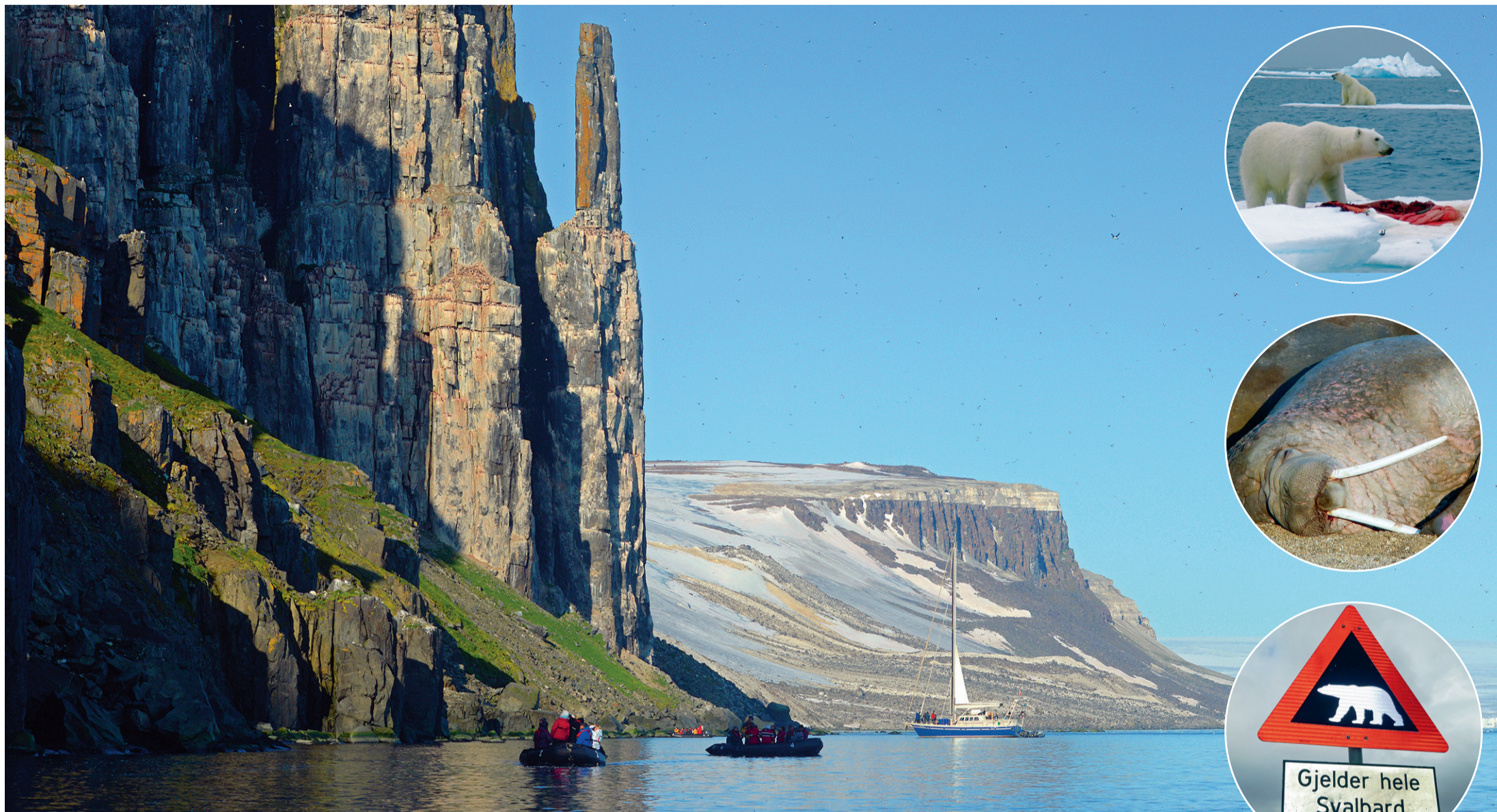
Le détroit Hinlopen est un paradis pour les ornithologues.