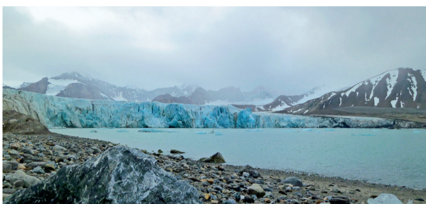
Spectaculaires, les glaciers du Spitzberg n'en sont pas moins en régression.

Scientifiques et passagers embarqués ont beau scruter la brume, tout ce que leurs jumelles perçoivent, ce sont quelques phoques et des vols de guillemots, eiders et autres sternes tourbillonnant autour du bateau. Ce n'est déjà pas mal. Le Macareux moine - qui doit son surnom de Clown des mers à son bec coloré - amuse les ornithologues. Mais voici qu'on annonce une surprise à bâbord. Précipitation vers les coursives. Aileron visible,