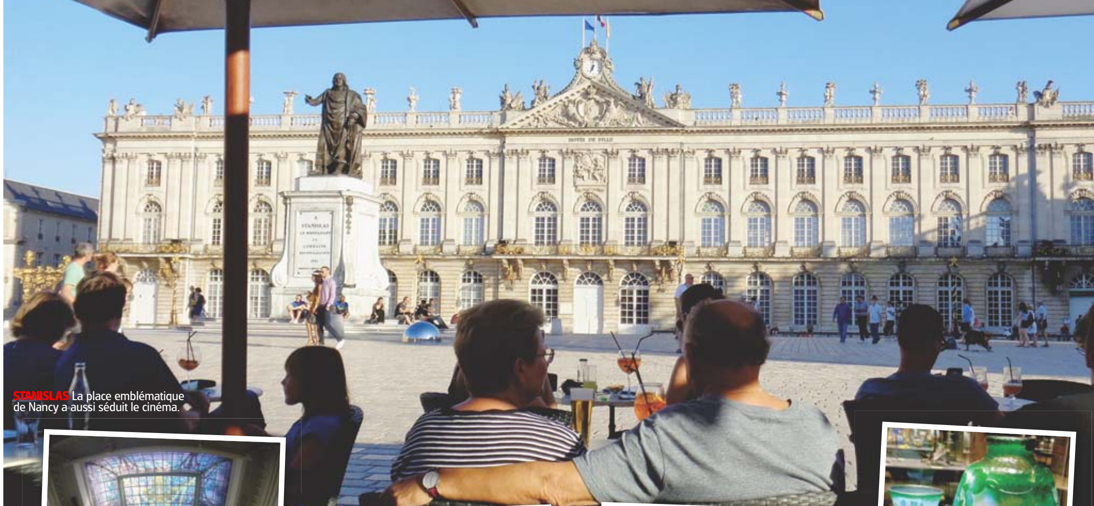
STANISLAS La place emblématique de Nancy a aussi séduit le cinéma.