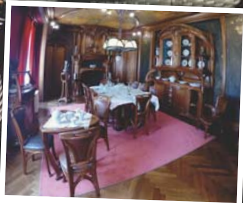
DÉCORUM Le Musée de l'Ecole de Nancy brille par ses collections.