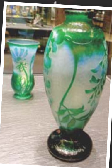
VERRERIE On peut aussi acheter des pièces contemporaines chez Daum ou Baccarat.