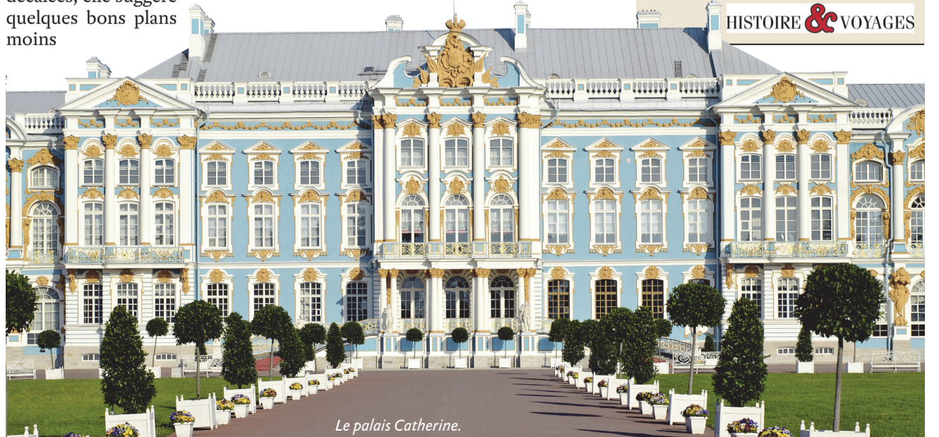
Le palais Catherine.

BP - Le régime soviétique a considérablement amélioré l'ancienne voie des tsars inaugurée au début du XIXe siècle. Long de 368 kilomètres, le parcours actuellement emprunté par les bateaux de croisière est un ensemble de rivières, lacs et canaux (dont celui de la mer Blanche, construit par des prisonniers du Goulag au prix de terribles souffrances). Dans les années 1960, 39 vénérables écluses ont été remplacées par sept nouvelles retenues permettant le transit de navires jusqu'à 5000 tonnes. Passant directement par les grands lacs au lieu d'emprunter les canaux de contournement, les bateaux ont ainsi gagné un temps considérable. Le parcours a de quoi séduire les voyageurs les plus blasés: paysages sauvages de Carélie et villages traditionnels distillent une subtile poésie. Points forts du trajet: le monastère de Saint Cyrille - plus riche témoignage de l'architecture religieuse du XVe siècle.