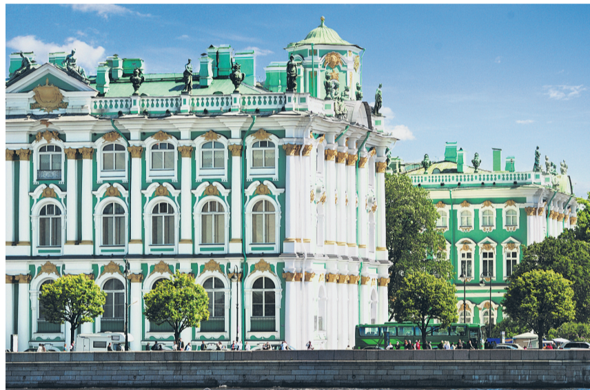
Saint-Pétersbourg: le musée de l'Ermitage est le plus grand du monde en termes d'objets exposés.

Bien sûr, ce n'est pas le Potemkine , mais l'un des plus vieux croiseurs à