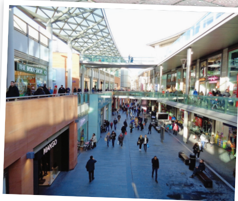
SHOPPING Liverpool ONE semble ignorer la crise.