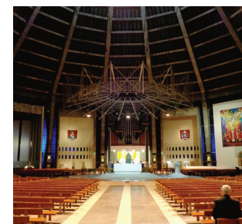
La cathédrale du Christ-roi édifée dans les années 60.

Ses détracteurs la comparent à un silo ou à un filtre à café renversé. Oui, elle est bien renversante, la cathédrale du Christ-Roi (catholique romaine) de Liverpool, édifée en béton dans les années 60. Si ses allures extérieures de tipi peuvent être discutées, l'atmosphère intérieure qui émane de sa nef circulaire ne peut qu'émerveiller, surtout si l'on a la chance de visiter l'église à l'heure d'une répétition ou d'une messe offrant en prime le chant des anges: une chorale majoritairement formée d'enfants, qui n'a rien à envier à celles d'Oxford ou de Cambridge. Dans cet édifice de 90 mètres de haut, reposant sur les voûtes d'une ancienne crypte, l'impressionnant maître-autel de 19 tonnes de marbre blanc, placé au centre, est illuminé par la lanterne couronnant l'édifice.