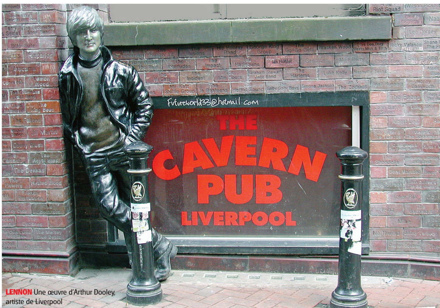
LENNON Une œuvre d'Arthur Dooley, artiste de Liverpool

Voilà donc des années que la ville vibre au tempo d'une beatlemania «qui pourrait encore bien durer cinquante ans», aux dires des guides du musée dédié aux Fab Four. Bien qu'excessif, le prix d'entrée à la Beatles Story ne décourage nullement les hordes de fans à investir un dédale résonnant de tubes inoxydables. La plupart poursuivront leur pèleri-