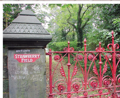
PÈLERINAGE Des lieux devenus mythiques par la chanson.