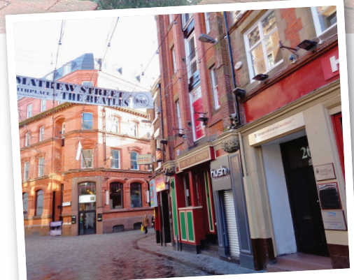
MATHEW STREET L'épicentre de la Beatlemania attire les touristes.

nage jusqu'au Cavern Club, reconstitution de la boîte légendaire où le groupe fit ses débuts. Certains se mettront même en quête de Strawberry Field ou de Penny Lane, autres adresses devenues mythiques.