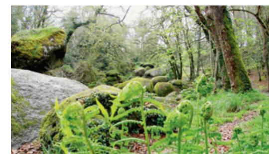
Brocéliande: la mythique forêt de toutes les légendes.