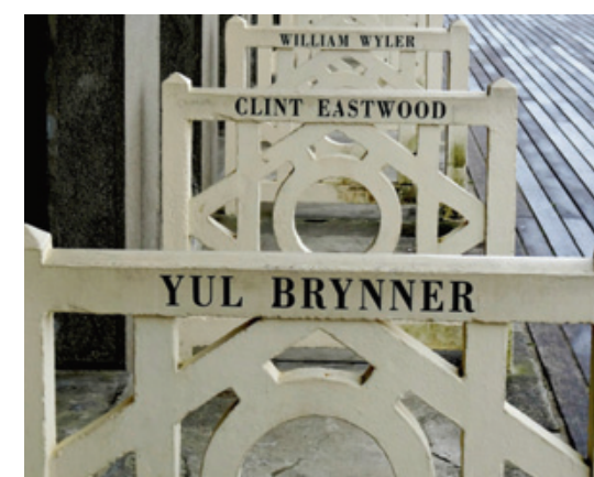
Deauville: références au cinéma sur la promenade des Planches.

éclairages n'a-t-elle pas fasciné Claude Monet et quelques comparses – Géricault, Millet, Dufy, Braque – mis au défi de fixer son ciel en perpétuel chamboulement. Corot plante son chevalet sur les rives de la Seine, Courbet immortalise un jardin de Honfleur et les vagues d'Etretat. Monet s'extasie face à la cathédrale de Rouen avant de s'installer à Giverny. Son bassin aux nymphéas inspirera un demi-siècle de peinture. Avant eux, Stendhal, George Sand, Zola et autre Baudelaire avaient déjà révélé le caractère ombrageux d'une beauté fatale capable de dérouter ses courtisans entre la sensualité de ses collines et la rudesse de ses falaises, le moelleux de ses laitages et l'âpreté de ses distillats, les pages roses de son histoire et les violences de ses conflits. La Normandie a aussi captivé les cinéastes: Lelouch, Zanuck, Tati, Demy. Elle a connu tant de péripéties qu'elle pourrait tisser sa propre intrigue autour des invasions vikings, de la guerre de Cent Ans, de la haine des Anglais, de l'implantation de la Compagnie des Indes occidentales et des terribles bombardements de la Seconde Guerre mondiale.