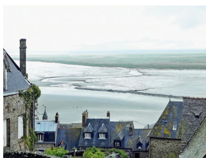
La baie du Mont-Saint-Michel, vue de l'abbaye.