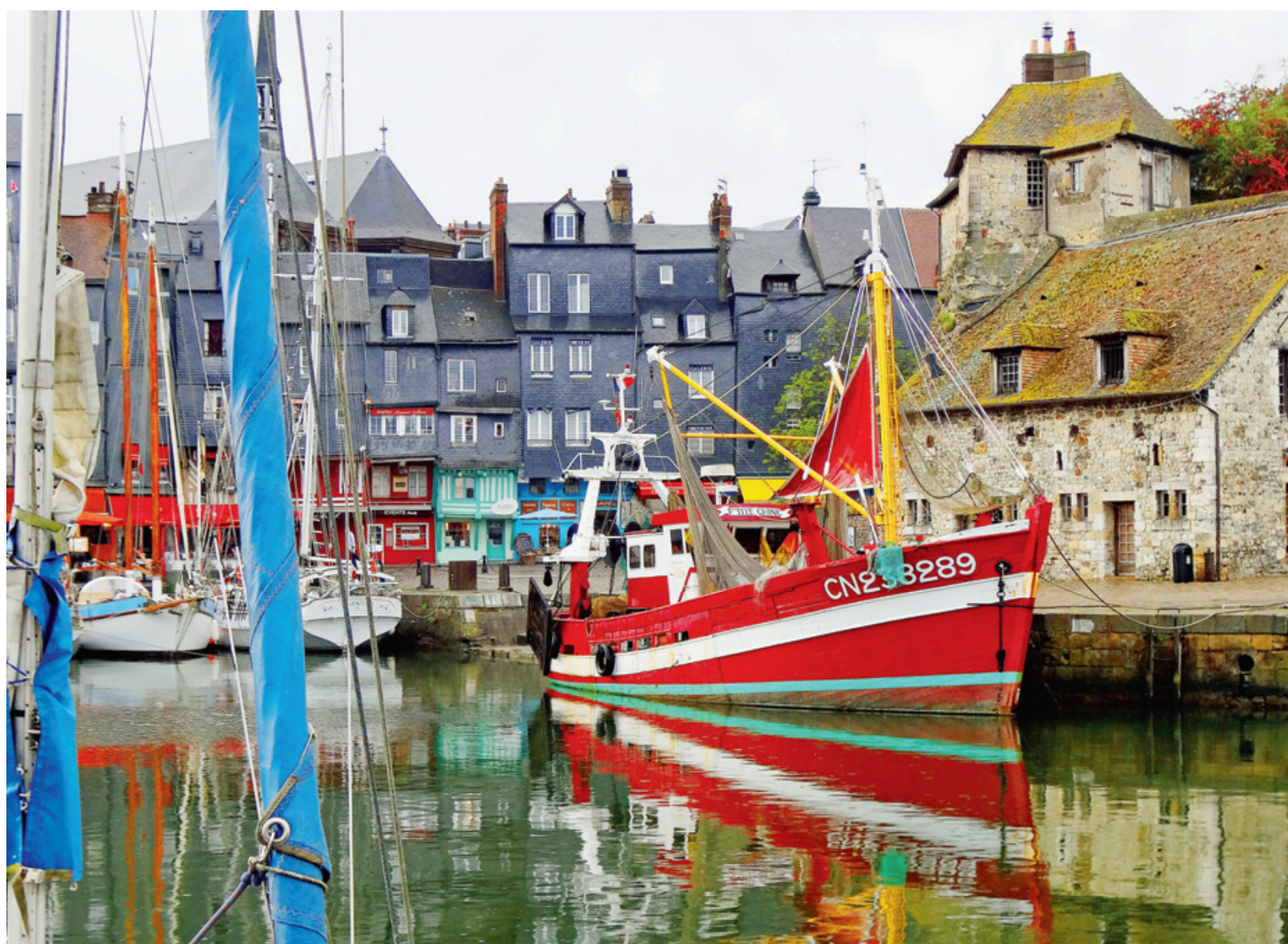
Honfleur: ses bâtisses des 16e au 18e siècle ont inspiré les grands maîtres.

Les passionnés d'histoire et de navigation ont de quoi se réjouir: 2019 s'annonce comme une année faste sur la Côte atlantique, avec notamment le 75e anniversaire du Débarquement. En outre, du 6 au 16 juin, Rouen accueillera l'Armada, la grande parade des bateaux de légende (une cinquantaine, dont l'«Amerigo Vespucci», le «Belem» et l'«Hermione»). Près de 8000 marins de toutes nationalités seront au rendez-vous. Les premiers à s'en réjouir sont les nombreux centres de thalasso répartis sur le littoral: le pionnier de Quiberon, le pimpant établissement de Carnac, le Miramar Crouesty – un grand classique –, etc. La meilleure façon de contrebalancer l'ambiance parfois un peu «clinique» de ces instituts reste de s'en échapper, le temps d'une promenade revigorante ou d'une belle découverte culturelle.