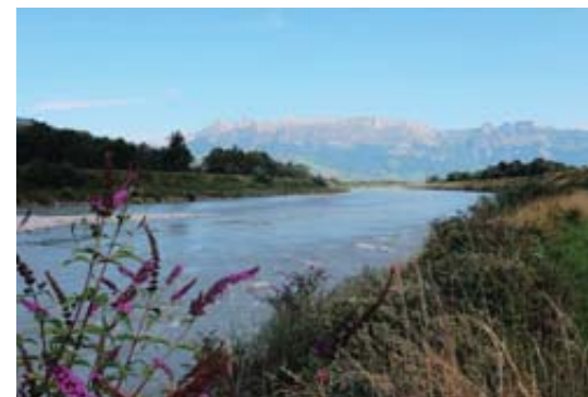
FRONTIÈRE Ici, le Rhin marque la frontière entre Suisse et Liechtenstein.