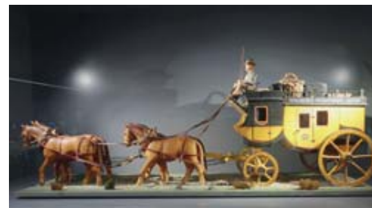
POSTE Le Musée des timbres retrace l'histoire des courriers postaux.