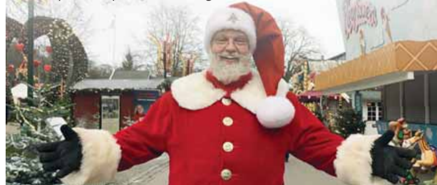
Si vous voulez rencontrer le Père Noël, rendez-vous à Bakken.

- Un jour, un certain Cliff Richard a légué un arbre à la ville d'Aalborg, au terme d'un concert. Depuis, d'innombrables artistes lui ont emboîté le pas... Tant et si bien qu'aujourd'hui, plus de 70 de ces végétaux diffusent des chansons de ceux qui les ont plantés, dont Sting, Stevie Wonder ou Elton John.