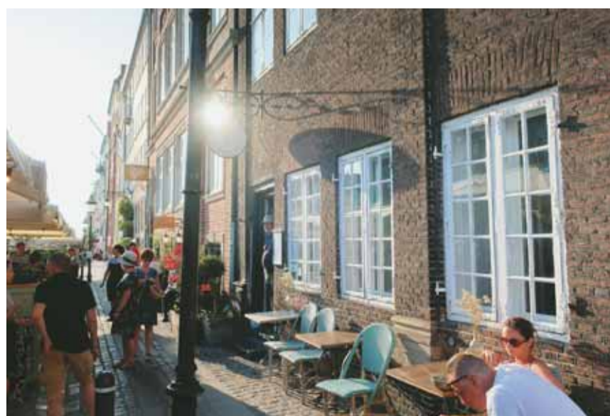
Plaisir de musarder dans les quartiers de Copenhague. BP

Dans cette partie de la Scandinavie, nombreux sont les sites historiques, comme la gigantesque forteresse circulaire d'Harold Blåtand, la mieux conservée en son genre. Avec son musée et les nombreuses activités proposées, Trelleborg a de quoi instruire et divertir les familles. Depuis 1952, chaque été, les locaux mettent en scène la saga viking dans le théâtre en plein air de Frederikssund. Quant à l'ancienne ville de Roskilde, également connue pour ses bateaux vikings, elle attire, début juillet, plus de 100'000 amateurs de musique dans l'un des plus grands festivals d'Europe, à seulement 20 minutes de train de Copenhague. ■