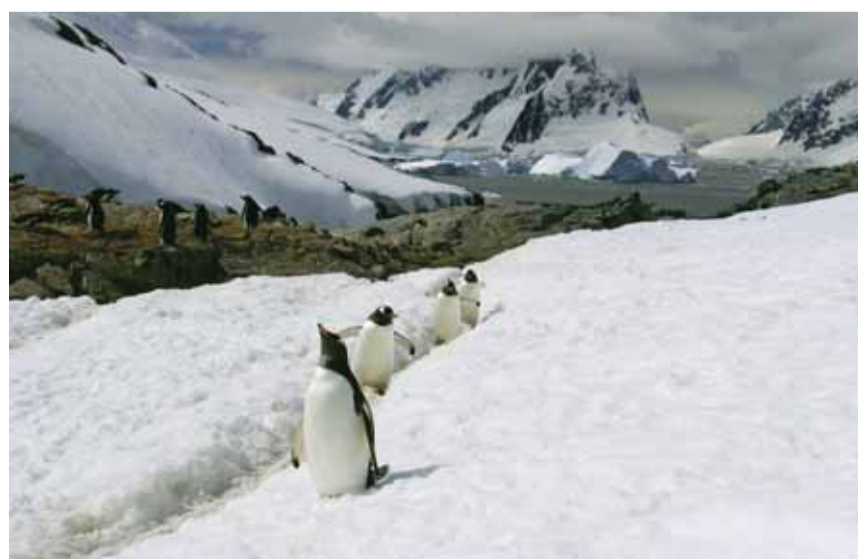
On recense huit espèces de manchots en Antarctique.

Un voyage en Antarctique laisse une impression unique et des souve-