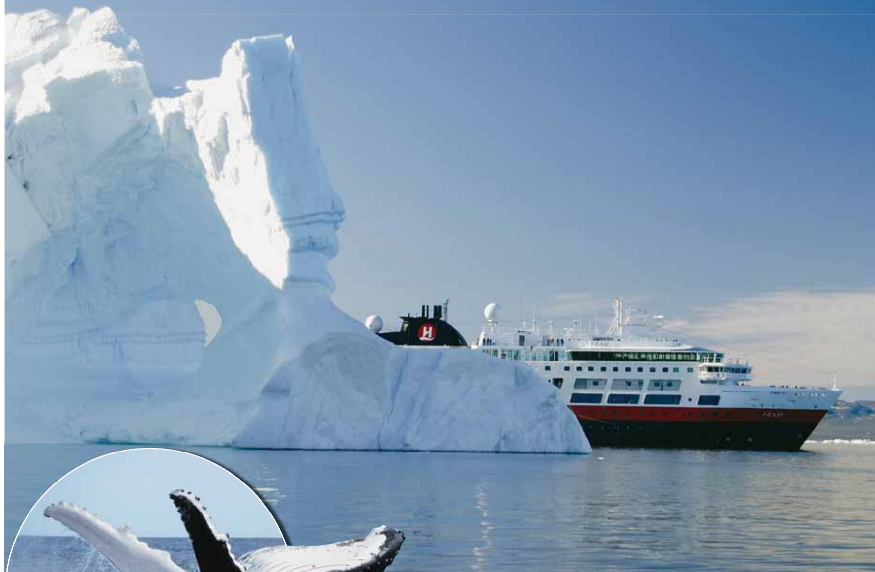
Le bateau Fram se fraie un chemin parmi les icebergs.