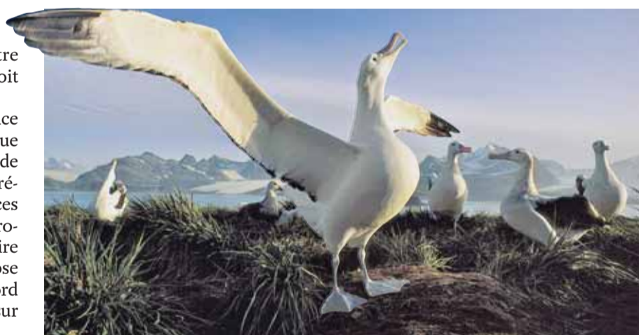
Falkland Island Albatros Kubny Arctic winter