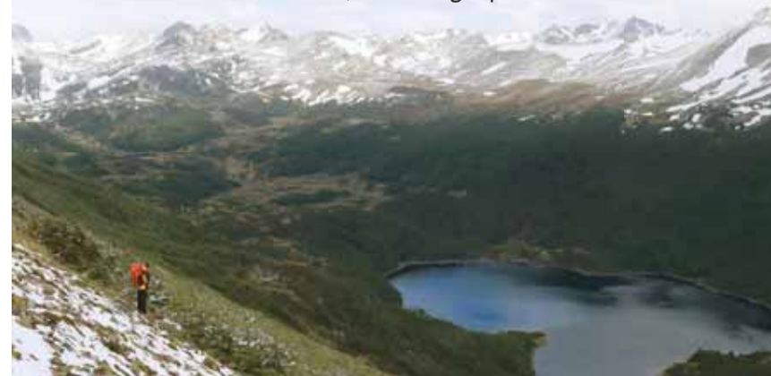
Randonnée dans le célèbre circuit des Dientes de Navarino au Chili.

Dans cette région parmi les plus extrêmes du Chili, les guanacos et les chevaux sauvages courent en liberté et les condors solitaires planent au-dessus de la cordillère de Darwin. Un des défis de cette destination est le circuit des Dientes de Navarino, le trekking le plus méridional du monde.