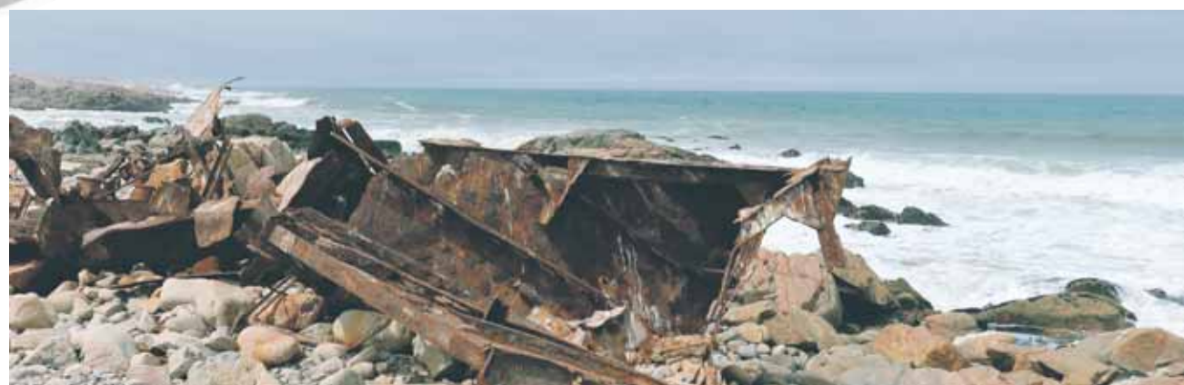
Des centaines d'épaves jonchent la côte des Squelettes.