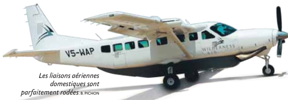
Les liaisons aériennes domestiques sont parfaitement rodées. B. PICHON

Un survol à basse altitude a tôt fait de démontrer que ce territoire - plus d'une fois et demie la superficie de la France et réputé désertique - n'a rien de monotone. Vastes espaces de terre