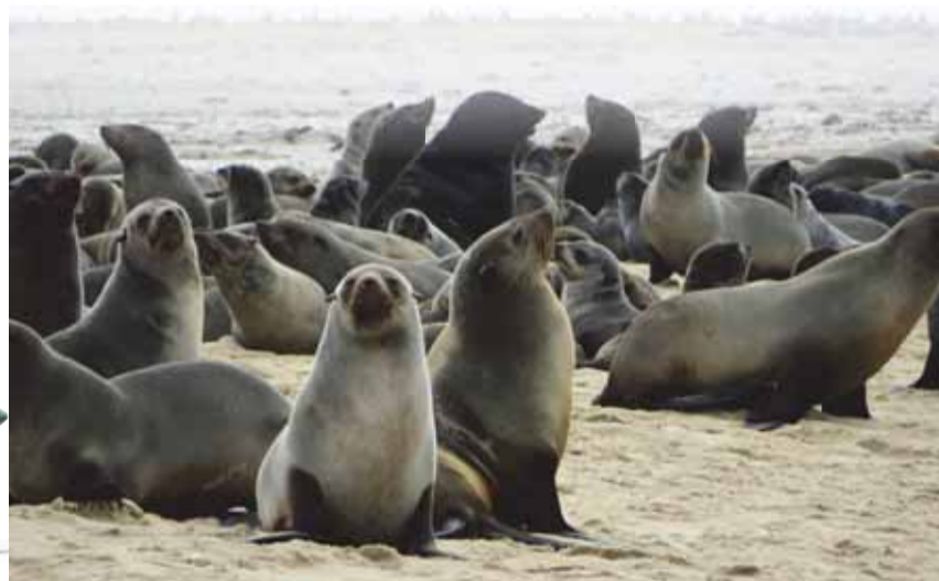
Une baie plus encombrée qu'une plage de Méditerranée!

Avant d'être qualifiée de côte des Squelettes, les Portugais avaient nommé Portes de l'Enfer cette portion de la Namibie. Difficile d'imaginer que c'est à la disparition d'un aviateur helvétique - Carl Nauer - qu'elle doit son actuelle dénomination, ou plus précisément à un journaliste de l'Agence Reuters qui couvrit le crash de l'avion de Carl Nauer en 1933. «Les ossements du pilote seront peut-être recueillis un jour sur cette Côte des Squelettes», avançait-il dans la conclusion de son article. On ne retrouva jamais le corps de notre compatriote, mais le terme passa à la postérité.