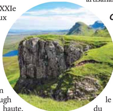
Magique île de Skye.