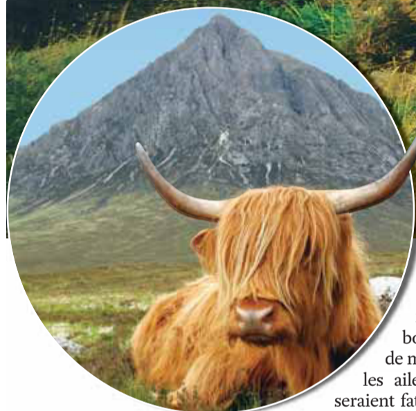
Des randonnées adaptées à toutes les conditions physiques.

vage, rempli de rochers, de cavernes, de bois, de lacs, de rivières, de montagnes si élevées que les ailes du diable lui-même seraient fatiguées s'il voulait voler jusqu'en haut».