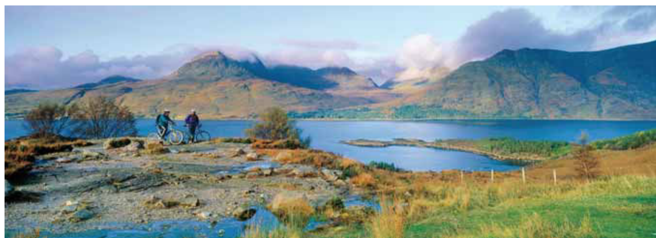
Un panorama particulièrement «instagrammable»!

La vaste île de Skye est un lieu vraiment magique, avec ses chaînes de