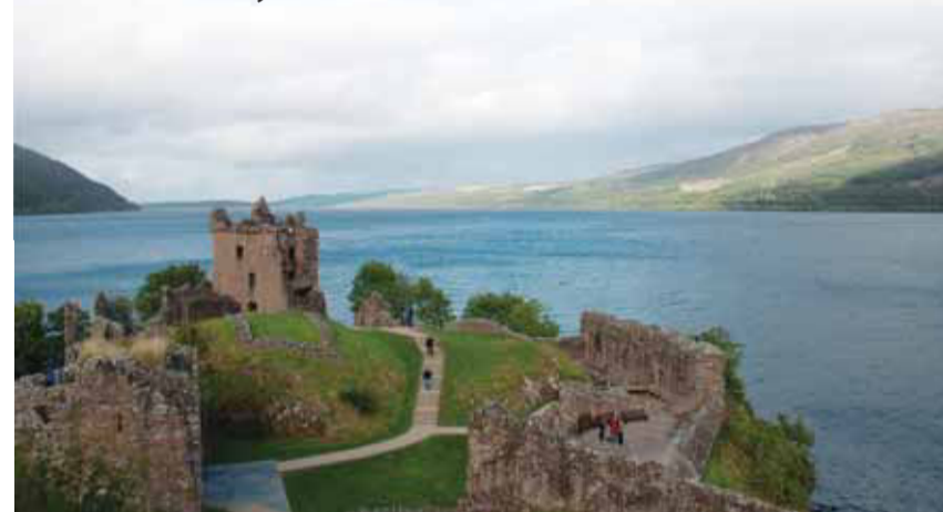
Le Loch Ness attire les amateurs de légendes.