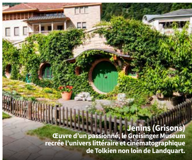
Jenins (Grisons) Œuvre d'un passionné, le Greisinger Museum recrée l'univers littéraire et cinématographique de Tolkien non loin de Landquart.

WAIKATU, NOUVELLE-ZÉLANDE VERSUS JENINS, GRISONS