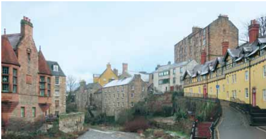
A Edimbourg, le hameau de Dean, un décor pour Harry Potter.

petits rapides noyés sous les frondaisons. Surplombant ce vallon encaissé, on a tout loisir d'observer des bâtisses de grès rouge aux façades à la flamande, hérissées de pignons crantés. Des maisons jaune canari ont été ajoutées dans le style Tudor, avec de faux colombages et des fenêtres à petits carreaux. Well Court est le pâté de maisons le plus recherché du hameau. Ces immeubles étaient à l'origine destinés aux travailleurs locaux. Une publicité des années 1880 décrivait ce lieu comme «fournissant des maisons de deux et trois pièces avec commodités, louées à une classe respectable d'ouvriers». ■