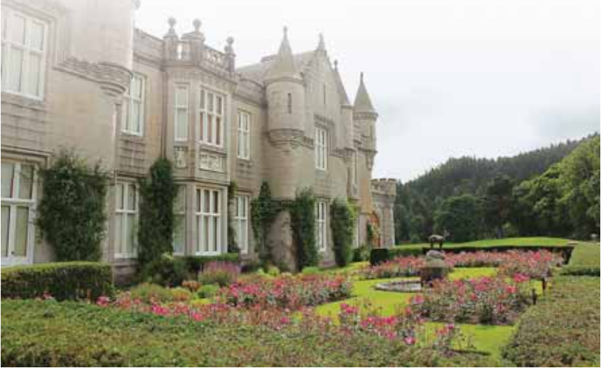
Balmoral, le château préféré d'Elizabeth II.

BP - Un voyage en Ecosse ne saurait faire l'impasse sur son incroyable patrimoine naturel, constitué de deux parcs nationaux et pas moins de 43 réserves. C'est dire si les randonneurs ont le choix des itinéraires. La plupart traversent des zones peu boisées, mais riches en fougères, mousses et bruyères. La visite de quelques châteaux emblématiques peut animer ces promenades: celui de Blair, notamment - dont la blancheur contraste avec la verdure qui l'entoure - et Balmoral, où Elizabeth II a poussé son dernier soupir l'an dernier. L'histoire de ce manoir en tant que résidence royale date de 1848, quand la maison fut louée à la reine Victoria et au prince consort Albert. Les Windsor ont agrandi le domaine jusqu'à couvrir une superficie d'environ 200 km 2 comprenant des landes, des forêts et des terres agricoles, ainsi que des troupeaux de cerfs et de poneys.