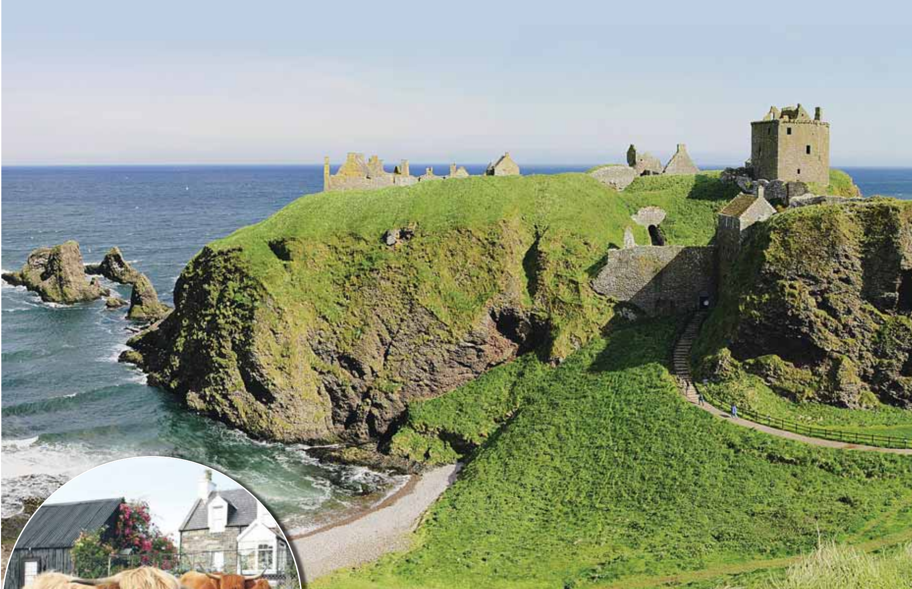
Emblématiques de l'Ecosse : nature et château (ici: Dunnottar).