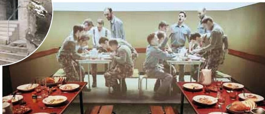
Ingénieuse scénographie au réfectoire.