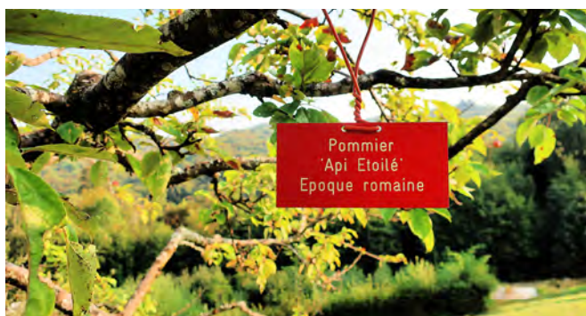
Une expérience didactique à l'Arboretum du Vallon de l'Aubonne (VD).

La Tine de Conflens offre une vision quasi amazonienne. Ses amoureux voudraient bien la garder secrète, comme les Neuchâtelois, leur Creux-du-Van! Son nom – en ancien français – signifiait «tonneau du confluent». En effet, les eaux tumultueuses du Veyron et de la Venoge se rejoignent ici pour creuser la roche et y former des sortes de cuvettes. De magnifiques chutes font le bonheur des chasseurs d'images et la joie des baigneurs... quand la température le permet.